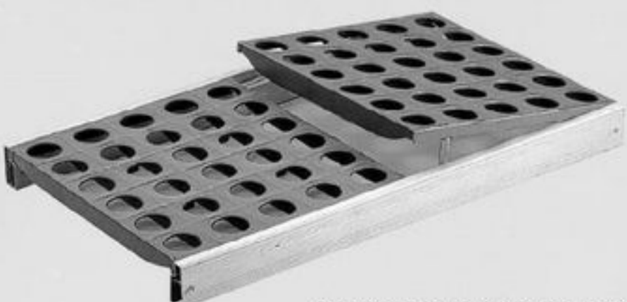
Baldas 6611 / Shelves 6611